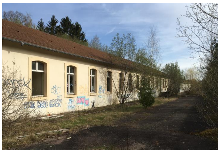
Vue sur les bâtiments de l'ancienne caserne Haxo

Requalification urbaine et paysagère, traitement d'un site dégradé Pré-aménagement de l'ancienne caserne Haxo, rue de Domèvre à Golbey (88)