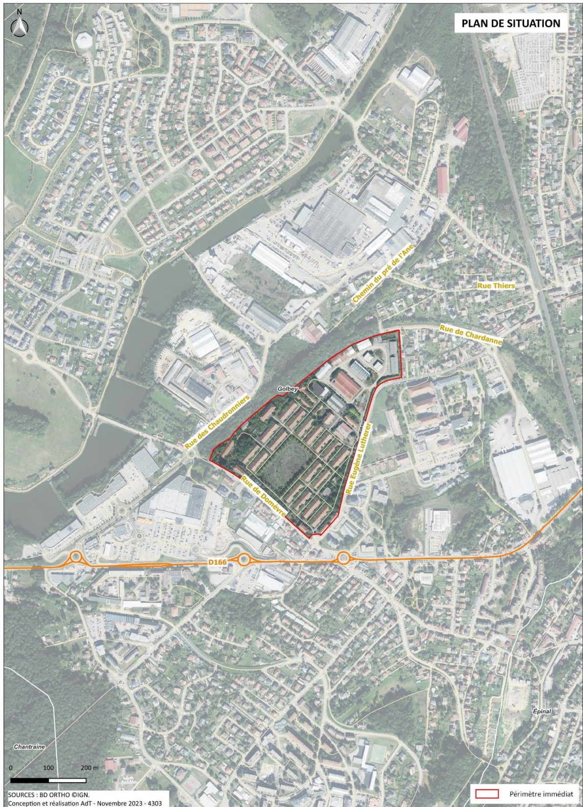
Figure 1 : Zone d'étude (phase 1 et phase 2)