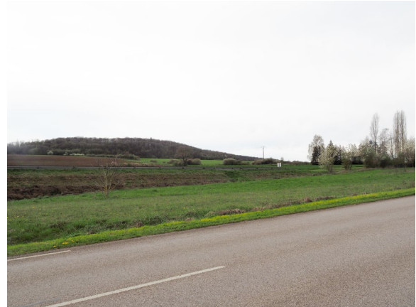
Le paysage composé au Sud de Baudricourt, vallons et boisements