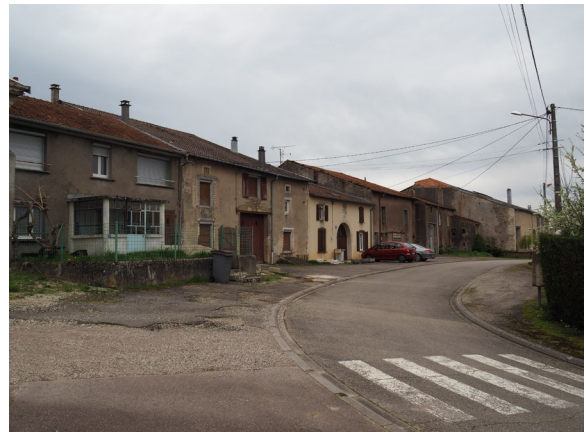
Exemple de logements anciens en centre-bourg, vacance élevée