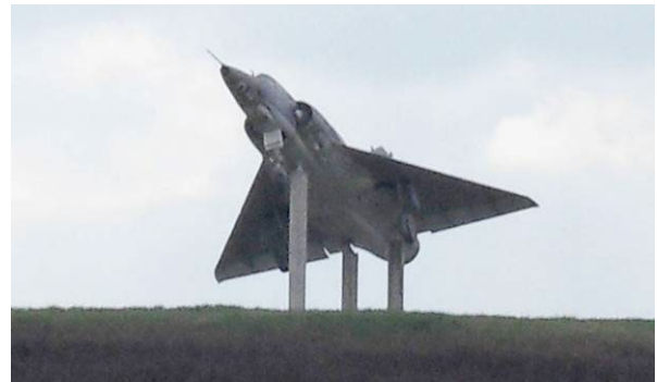
Appel visuel depuis la RD 166