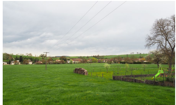
Intégration du bâti dans le contexte paysager