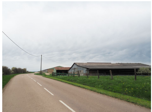
Une exploitation agricole à Baudricourt