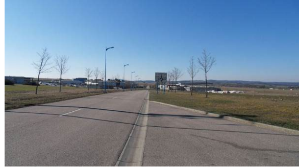
Unique accès vers l'Aéropôle