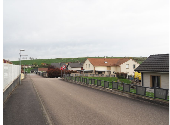
Lotissement à l'entrée de Baudricourt