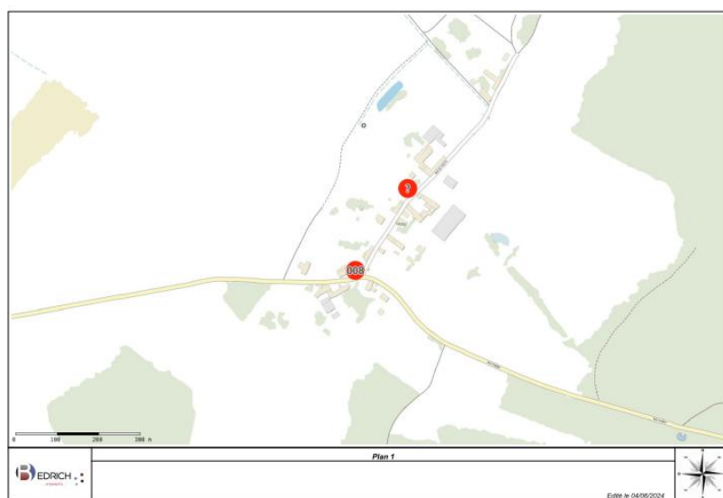
Hameau de Trotte

La commune de Vandières dispose de plusieurs points de défense incendie répartis sur le bourg et sur le hameau de Trotte.