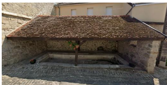
Le lavoir public de la rue principale