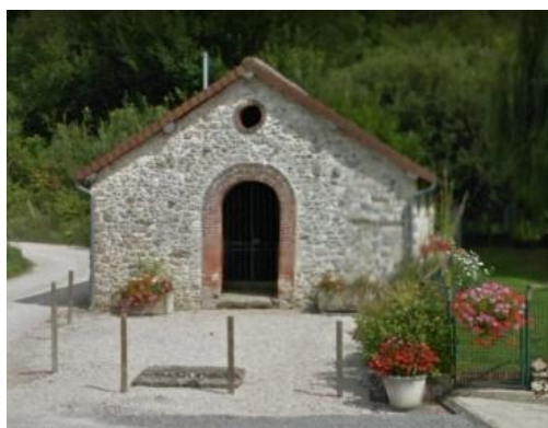
Le lavoir public rue Gamache