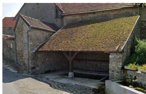
Le lavoir public du hameau de Trotte