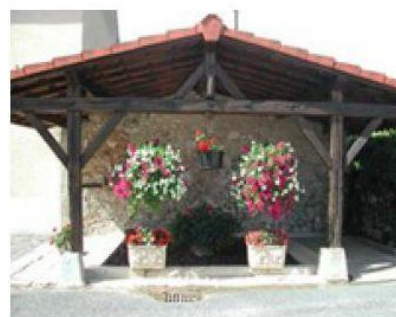
Le lavoir public de la Tuilerie