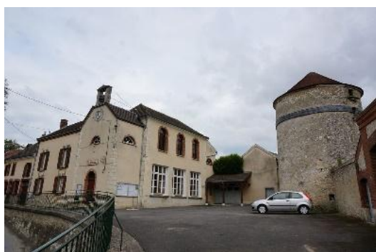
Le Pigeonnier au centre du village

⇒ La commune souhaite préserver plusieurs éléments de son patrimoine local :