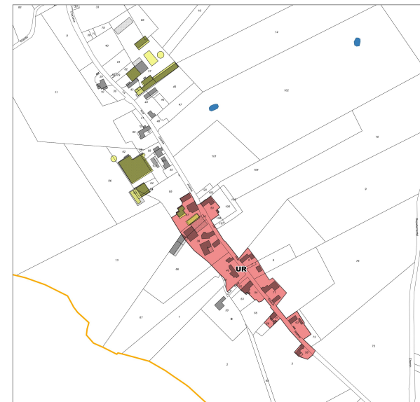
Rue Grande Jeanne