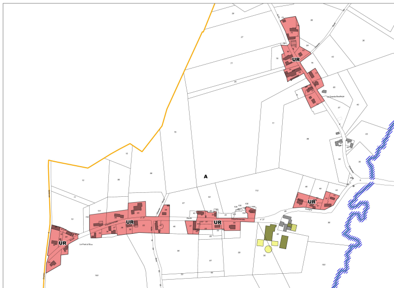
La Grande Bouloye