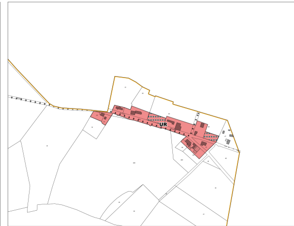
Hameau rue Desmaretz