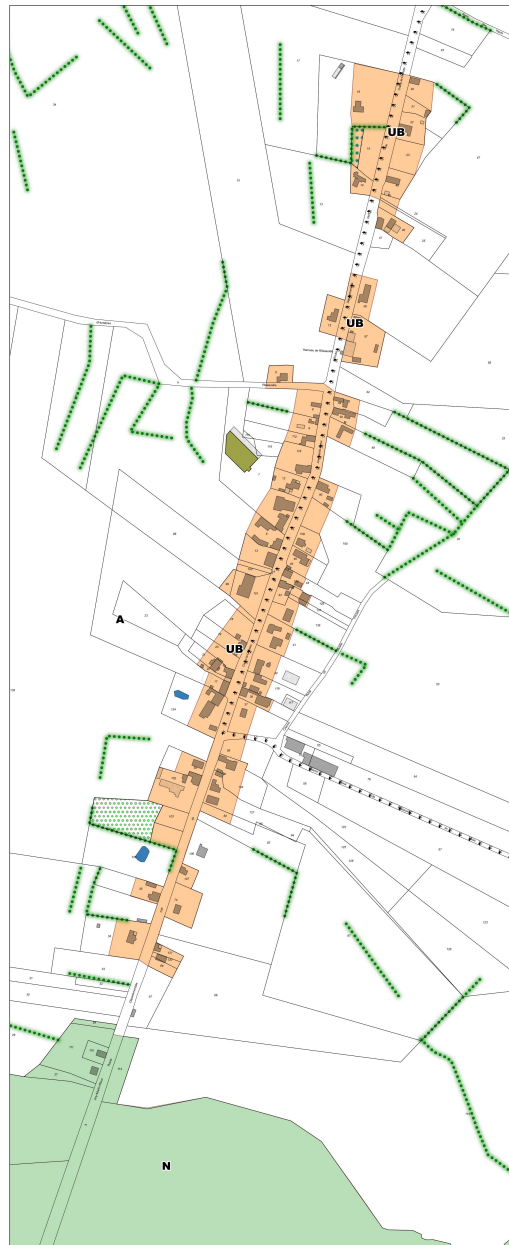
Hameau de Ribeuville