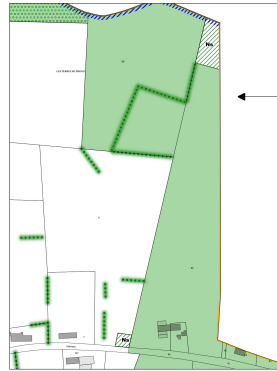
Zoom sur les STECAL au 1/2500ème