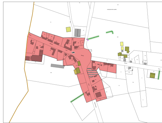
Hameau de Bellevue