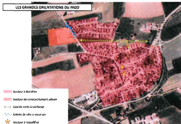
LES GRANDES ORIENTATIONS DU PADD

Document d'information – Révision du PLU de BEUVEILLE