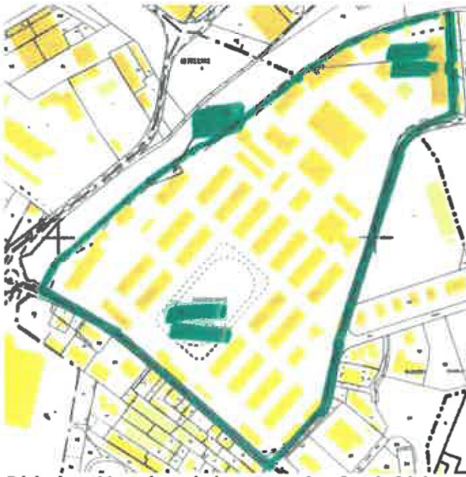
Périmètre Haxo issu de la convention fonds friche signée par la commune de Golbey