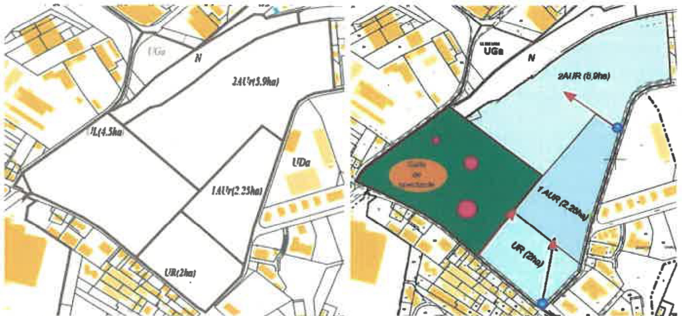
Périmètre Haxo, issu respectivement de la page 5 des documents graphiques et de la page 6 de l'OAP de l'actuelle révision du PLU