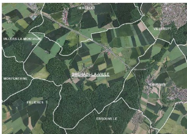
Figure n°2 : vue aérienne