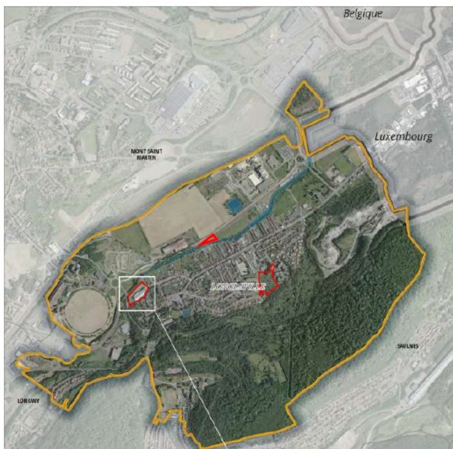
Figure 2: localisation des secteurs concernés par la modification du PLU de Longlaville

Les principaux enjeux environnementaux identifiés par l'Autorité environnementale sont :