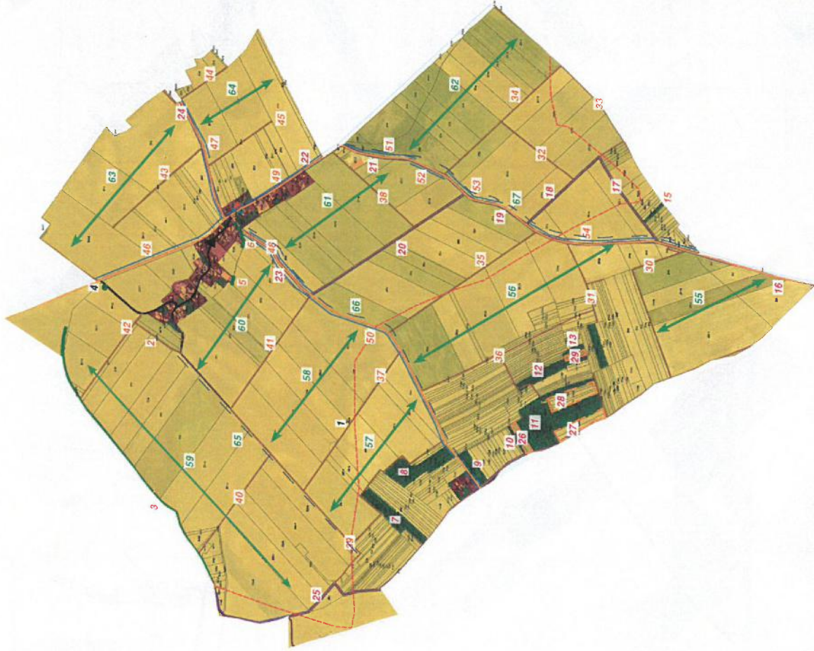
Figure 13 : Carte des propositions environnementales