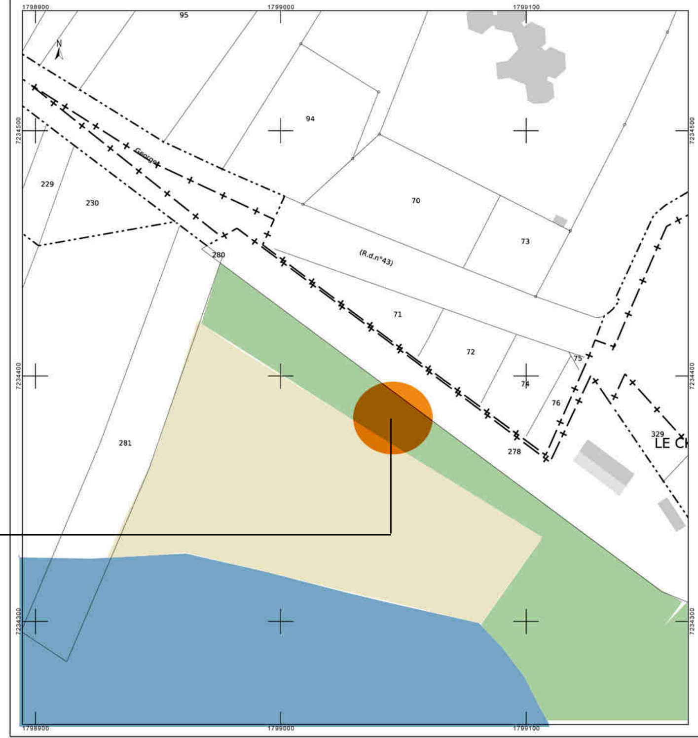
NOUVEAU POSTE DE SECOURS