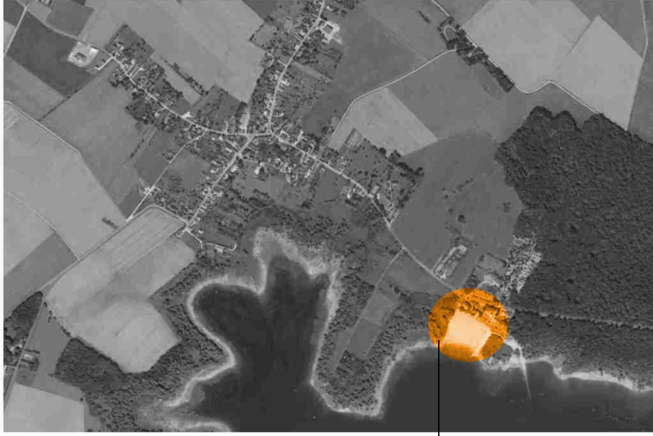
PLAGE DE GERAUDOT