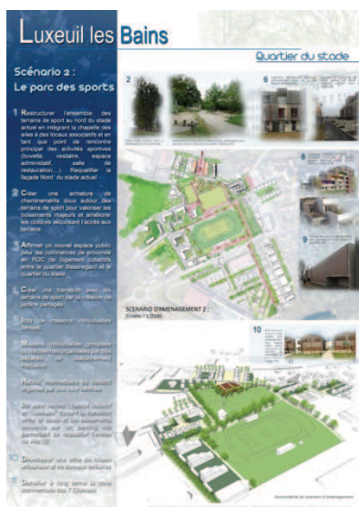
Exemple de scénarii illustrés