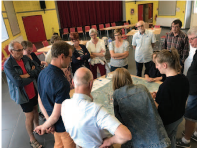
Restitution des perceptions autour de tables

Des débats constructifs organisés en fonction d'un processus de projet