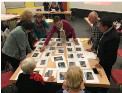
Définition collectives d'intentions de projet