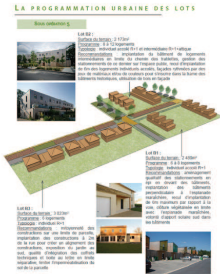
Exemple de programmation urbain à travers une fiche de lots

Cette phase se traduit par la production d'un rapport illustré et détaillé permettant de comprendre le fonctionnement d'ensemble du projet (plans et coupes aux échelles adéquats) ainsi que les modalités de réalisation de l'opération (bilan, phasage, actions à conduire...)