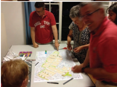
Exemple d'animations autour d'une maquette