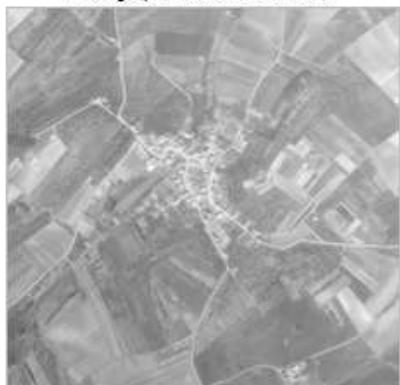
Photographie aérienne de 1979