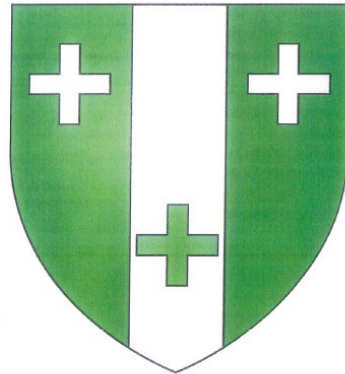
Le blason de Flainval