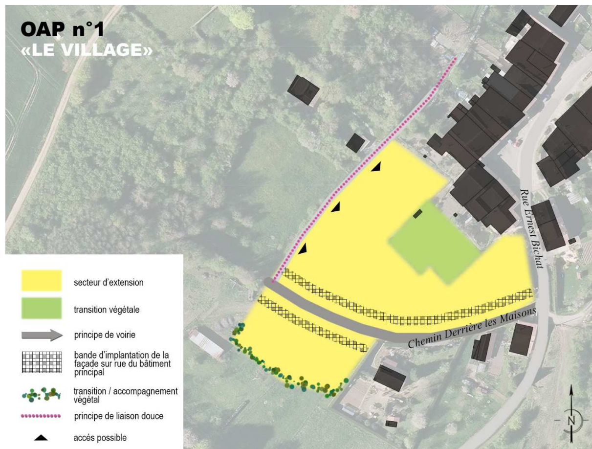
Schéma d'aménagement du secteur

Un accompagnement végétal des voiries ou des cheminements pourra apporter la qualité paysagère nécessaire au quartier. Les voiries partagées seront favorisées pour toute création de rue de desserte.